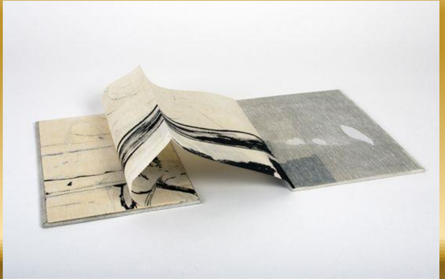
Libro de Artista, Serie I, (1), 2011, Nunik Sauret